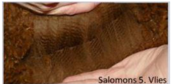
Salomons 5. Vlies